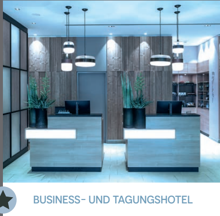
BUSINESS- UND TAGUNGSHOTEL