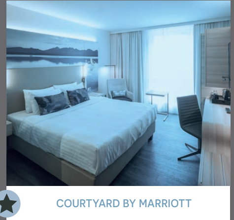
COURTYARD BY MARRIOTT